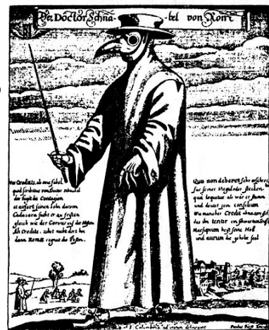
Pestdokter – 'Dokter Snavel' in pest-kledij (gravure 1656)