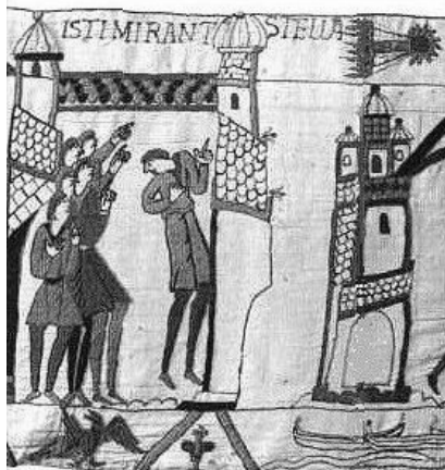
Komeet van Halley op Tapijt van Bayeux (1077) – Natuurfenomenen worden vaak als een voortekenen gezien: 'When beggars die there are no comets seen / The heavens themselves blaze forth the death of princes' (Shakespeare, Julius Ceasar). Natuurfenomenen kunnen door iedereen waargenomen worden en tot een collectief geloof in voortekenen leiden. In de brief aan Baling gaat het om een individuele verbeelding, die maar door één persoon waargenomen wordt. Het collectieve element ontbreekt.

Voortekenen zijn fenomenen van de waarneming, want ze komen tot ons via de zintuigen. Ze