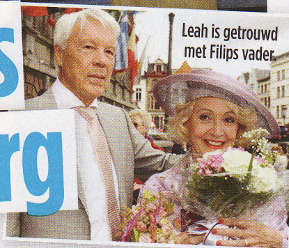
Leah is getrouwd met Filips vader.