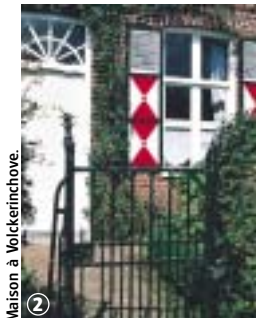
Maison à Volckerinchove.

Circuit, au patrimoine varié, praticable toute l'année. Le circuit court s'adresse plus particulièrement aux familles. Il ne passe pas à la chapelle Sainte-Mildrède mais un aller-retour de 1500 m permet d'admirer l'édifice. En période de pluie, prévoir de porter des chaussures étanches.