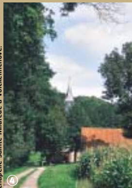
Chapelle Sainte-Mildrède à Volckerinchove.

Le village de Millam est situé sur la ligne de crête qui sépare la Flandre intérieure et la Flandre maritime ;