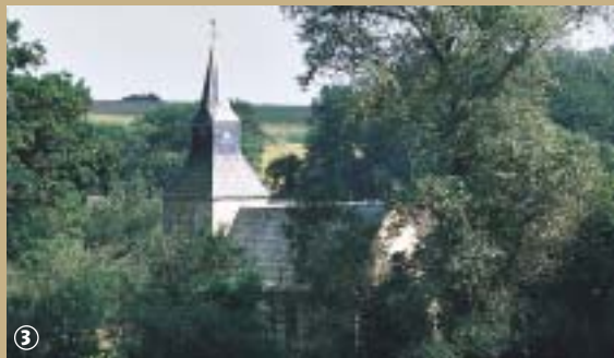
Chapelle Sainte-Mildrède à Volckerinchove.

Le village de Millam est situé sur la ligne de crête qui sépare la Flandre intérieure et la Flandre maritime ;