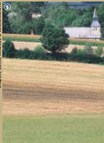
Chapelle Sainte-Mildrède à Volckerinchove.

d'ailleurs, la commune elle-même est divisée en une partie haute aux petites ondulations et une partie basse inondable, parfaitement plate. Etymologiquement, Millam proviendrait de « Middel » signifiant milieu et « Ham », une langue de terres qui domine les contrées marécageuses voisines. L'existence de terres inondables est l'une des explications de la venue de Sainte Mildrède dans la région peu avant l'an 700. La chapelle qui lui est dédiée, a été restaurée en 1702 et est un haut lieu de pèlerinage dans la région. Elle est nichée au fond d'un vallon et a conservé une part de mystère, qui se dévoile uniquement sur rendez-vous.