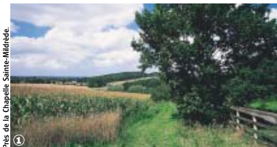
Près de la Chapelle Sainte-Mildrède.

Bocage Flamand et marais Audomarois, au fil de l'Yser