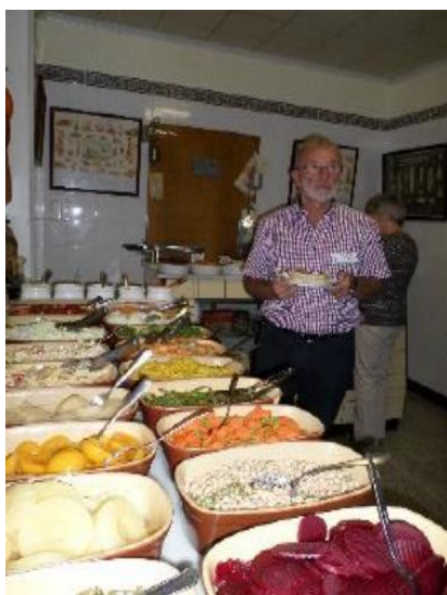
Aanschuiven voor de Breugelmaaltijd !