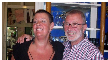
Samen eens op de foto met de charmante uithatster hmm hmm :-)