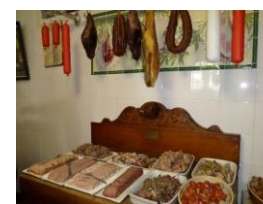
Van het goede te veel

De Carabiniers waren te gast in het hof van Commerce te Stavele aan de IJzer