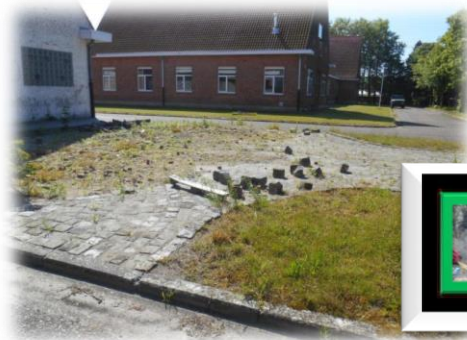
Rechter foto hier stond eens onze gedenksteen In het ingezette kadertje rechterfoto bmerken we onze aalmoezenier Heregods