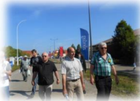
op weg naar stand 95