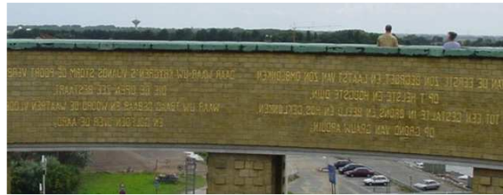
Je kan in het monument boven rond wandelen