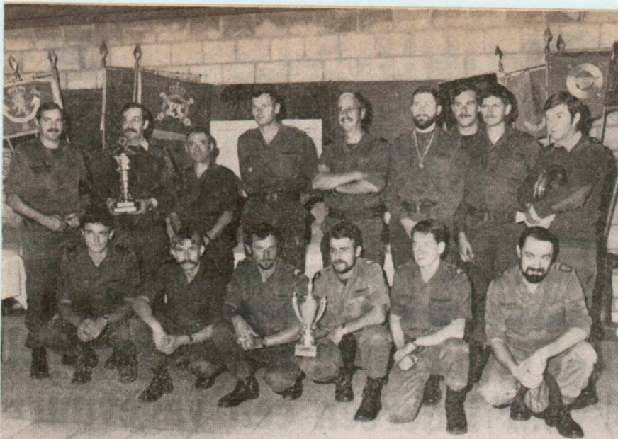
SPORTIEVE MILITAIRES TE LEOPOLDSBURG. — Sport bij het leger hoort als onderdeel van de opleiding en training. Te Leopoldsburg had een algemene sportdag plaats onder de eenheden. De beker van de brigade werd gewonnen door het regiment Carabiniers Prins Boudewijn