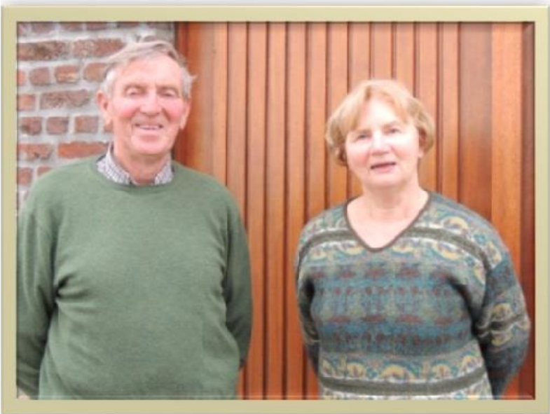
De op rust gestelde Boer en boerin