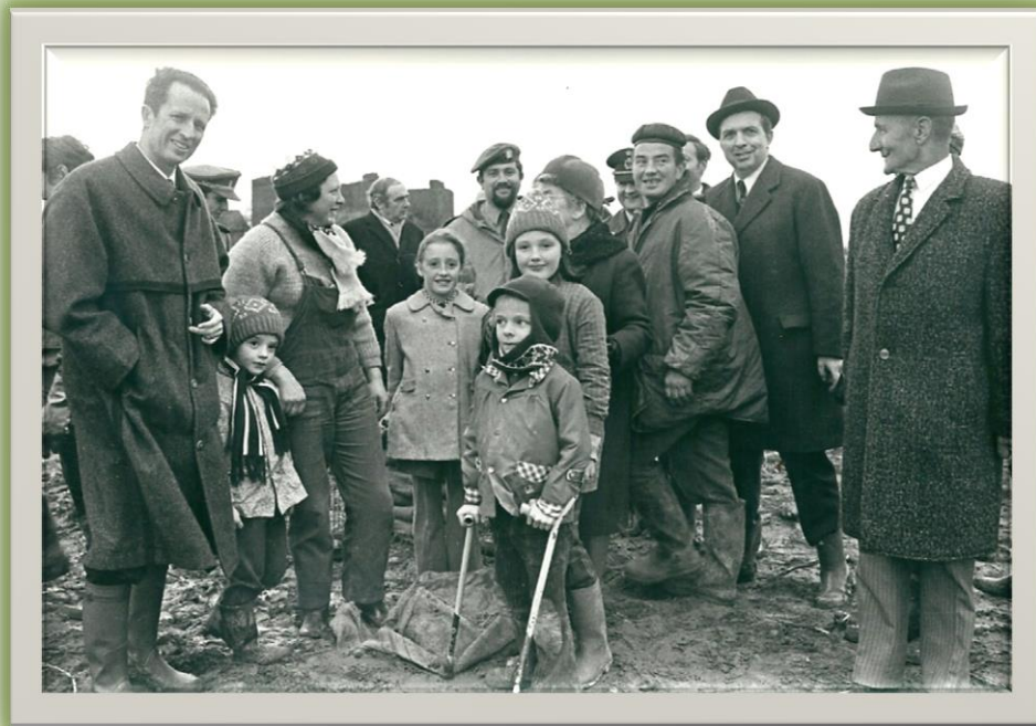
Tussen de Koning en de Boerin het kleine manneken nu de uitbater van het bedrijf aldaar, de militair op de achtergrond Lt