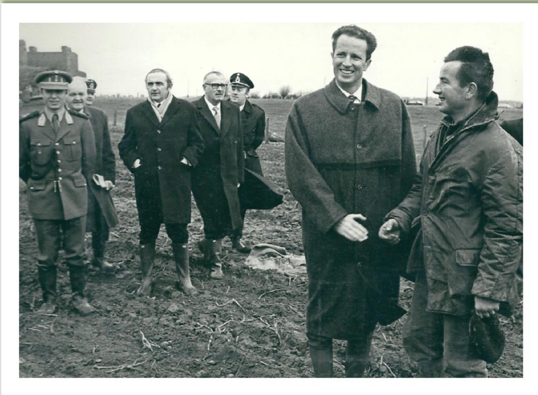
De verwelkoming van de Koning met Landbouwer Willy Rooryck op het aardappelveld de Koning was vergezeld van Landbouw Minister Lavens en Gouverneur. Pierre van Outryve d'Ydewalle* .

*geboren te Gent 07-01-1912 † Brugge 03-01-1997