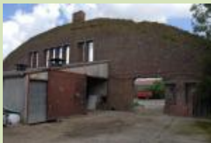
gevel van vliegtuigloods

Type: Gebouw - Militair of Burger: Militair stuk tekst en foto 's uit de hier boven vermelde Site voor meer zet uw zoektocht verder met boven vermelde URL !