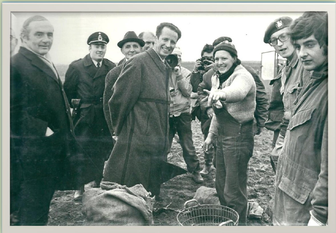
Op de foto de Koning met de Boerin in een hartelijk gesprek we bemerken hier rechts sm Aluin en met de bril vermoedelijk ?Vercame of Sgt-mil Vroman (is zeker vermeld op het bedrijf van Rooryck info boek boerenhulp 1974)